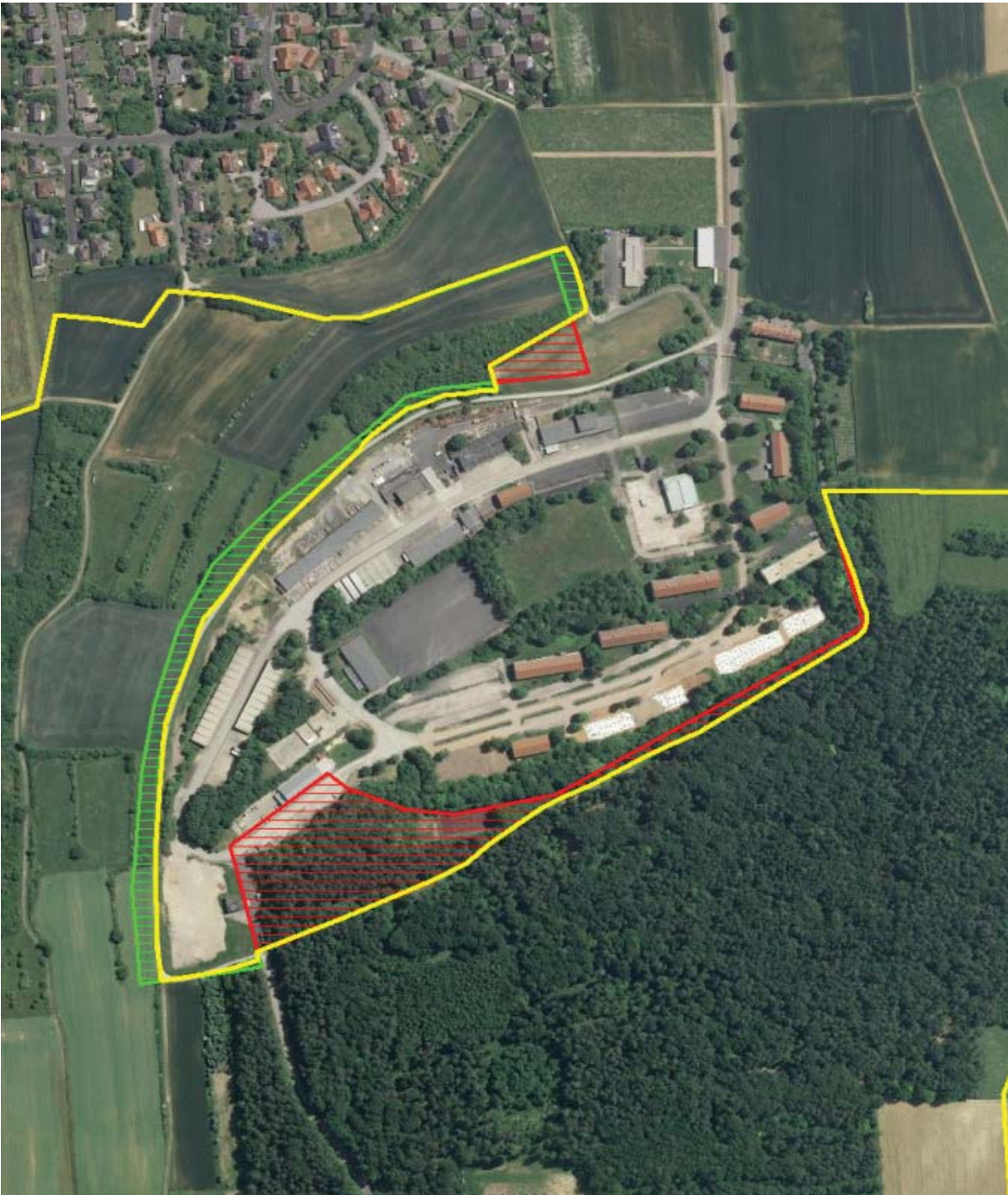
Anlage 1 zur „Fünften Verordnung zur Änderung der Verordnung über des Landschaftsschutzgebiet „Bayerische Rhön“ vom 01.12.2003 Nr. 00233/01 – 01/00“